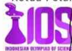
Imanda Al - Fath, S.Ds